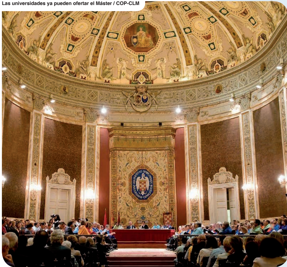
Las universidades ya pueden ofertar el Máster / COP-CLM

zados y registrados como Centros Sanitarios en los Registros de centros, servicios y establecimientos sanitarios de la correspondiente comunidad autónoma. Queda pendiente saber qué vías habilitará el Gobierno para todos aquellos psicólogos que, reuniendo los requisitos de formación establecidos en la Disposición Adicional Sexta de la Ley 5/2001, puedan seguir desarrollando actividades sanitarias, sin necesidad de cursar el Máster en Psicología General Sanitaria, tal y como ha solicitado el COP a los Ministerios correspondientes en numerosas ocasiones.