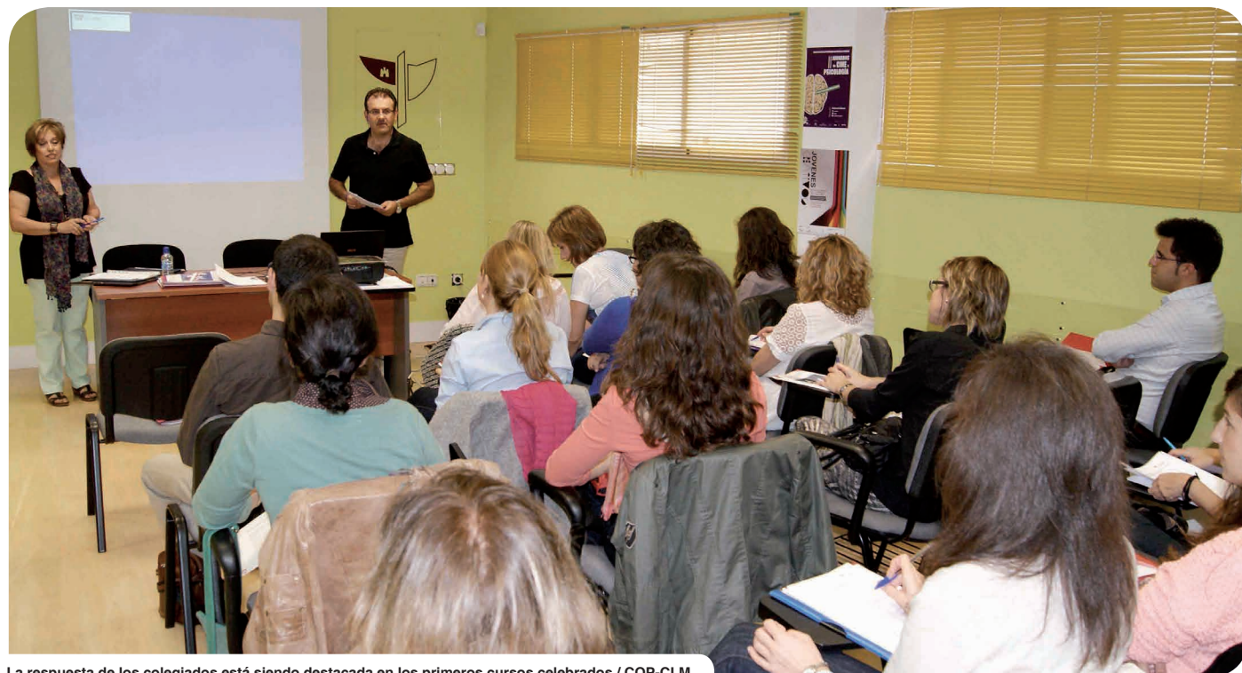
La respuesta de los colegiados está siendo destacada en los primeros cursos celebrados

En total, más de 50 propuestas de formación y más de 20 conferencias, enmarcadas dentro del 'IV Ciclo de Charlas Abiertas de Psicología', conforman la completa oferta concebida por la institución colegial de cara al curso 2013-2014, que ha arrancado con fuerza y con un importante cantidad de inscripciones en toda la región