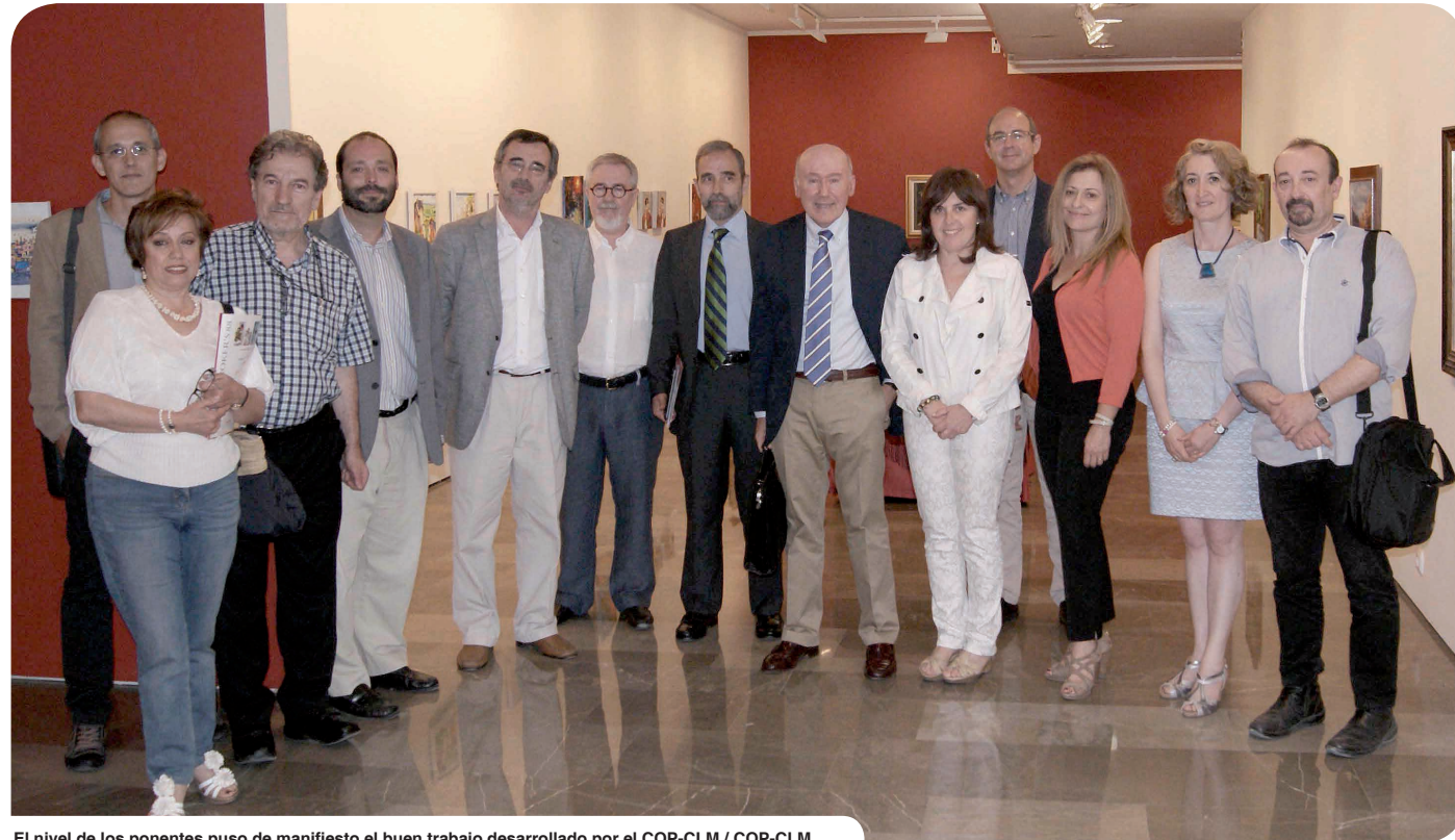
El nivel de los ponentes puso de manifiesto el buen trabajo desarrollado por el COP-CLM / COP-CLM