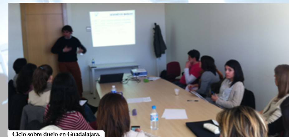
Ciclo sobre duelo en Guadalajara.

Por último, los talleres programados en Toledo fueron el Taller de casos prácticos según el Código Deontológico, y el Taller de informes de Psicología Jurídica: Familia. En cuanto a los cursos estipulados en el Plan de Formación 2014-2015 para Toledo, éstos fueron Abordaje psicológico en patología dual, Claves para la detección e intervención con menores en familias con violencia de género, Autodiagnóstico de las competencias para la Igualdad, Evaluación de la capacidad laboral y simulación, y Psicología de la Actividad Física y del Deporte.