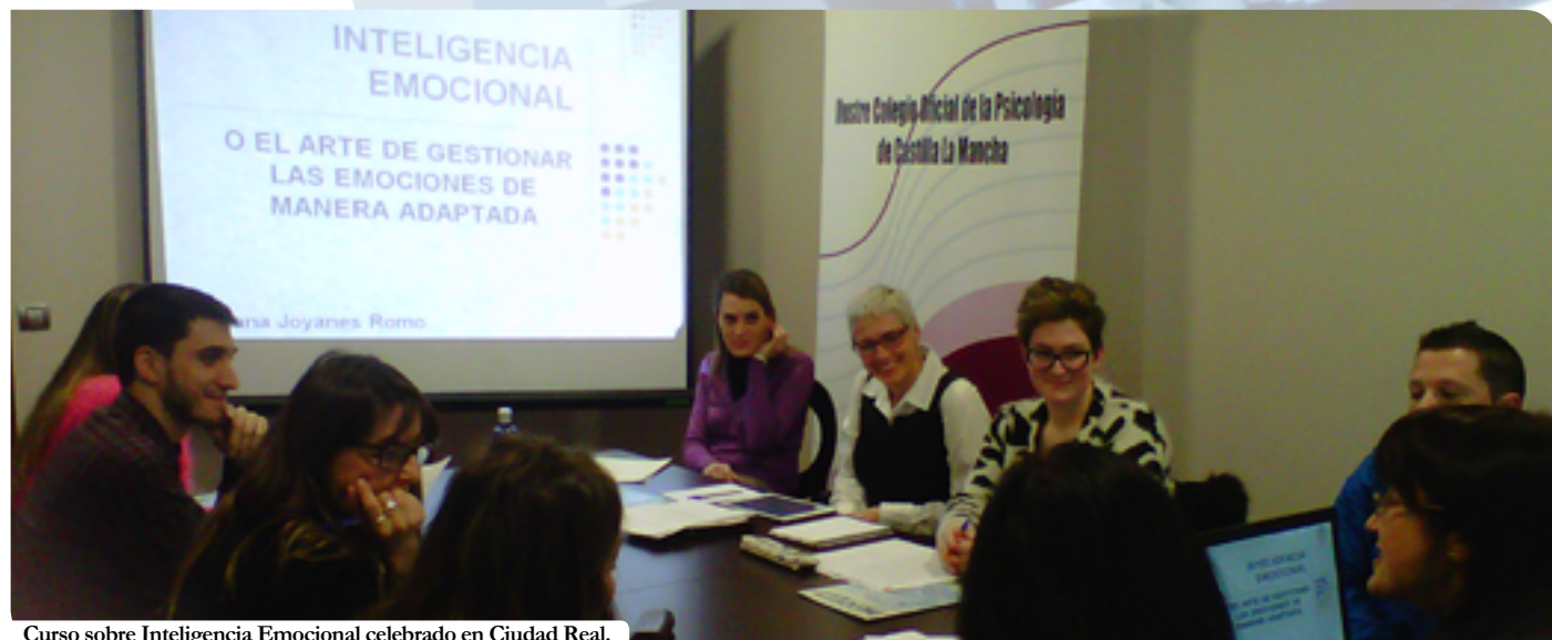
Curso sobre Inteligencia Emocional celebrado en Ciudad Real.

tes talleres: Taller sobre Dilemas éticos y deontológicos: cómo resolverlos, Taller de Informes de Psicología Jurídica: Familia, y Taller de Informes neuropsicológicos. En cuanto a los cursos proyectados en esta provincia, éstos fueron Intervención en Acoso escolar, Grupo de indicaciones a la psicoterapia, Especialización en Coaching Educativo, Valoración pericial en caso de abuso sexual infantil, Principios de Psicofarmacología, Terapias cognitivas de Tercera Generación: Mindfulness y terapia de aceptación y Compromiso, Psicología Positiva, Salud y Educación una asociación indivisible, Autodiagnóstico de las competencias para la Igualdad, Técnicas ágiles de creatividad y comunicación para profesionales de la Psicología, Iniciación al lenguaje de signos español, y Auto-