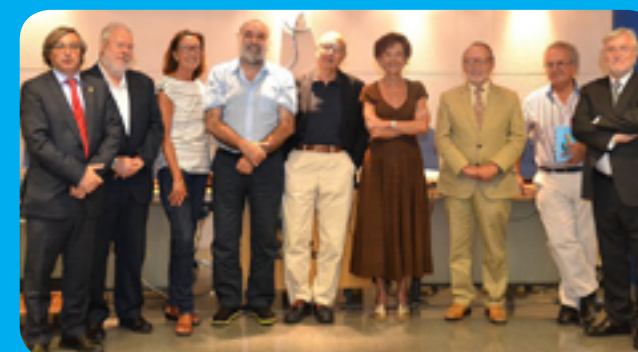
European Federation of Psychologists' Associations (EFPA).