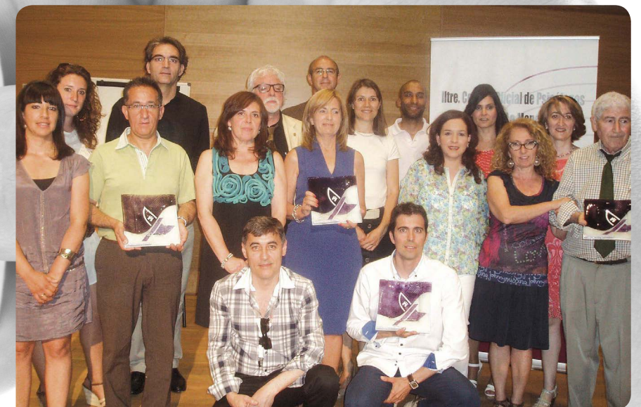
La edición de 2012 tuvo lugar en Guadalajara y en ella se reconoció la labor de varios profesionales

Así pues, la VI Jornada Psicología y Sociedad cuenta con numerosos e interesantes alicientes como para que la asistencia al evento sea elevada. Además, coincide con la celebración de la 'Feria de la Psicología', por lo que es posible que el aforo previsto para la celebración se quede pequeño a pesar de su capacidad por lo que se recomienda no esperar a última hora cumplimentar la pertinente inscripción.