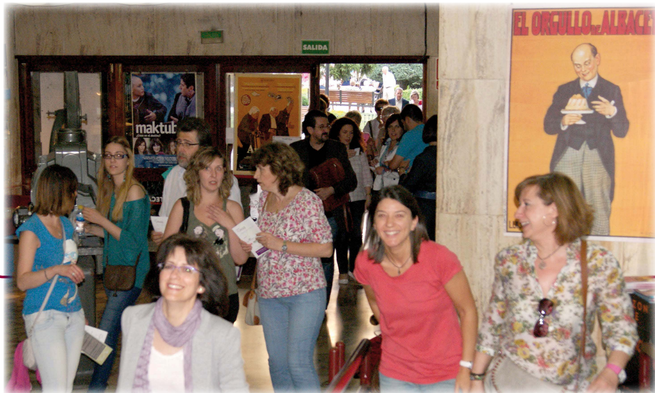
La anterior edición estuvo dedicada a la Sexualidad y generó mucho interés entre la sociedad albaceteña