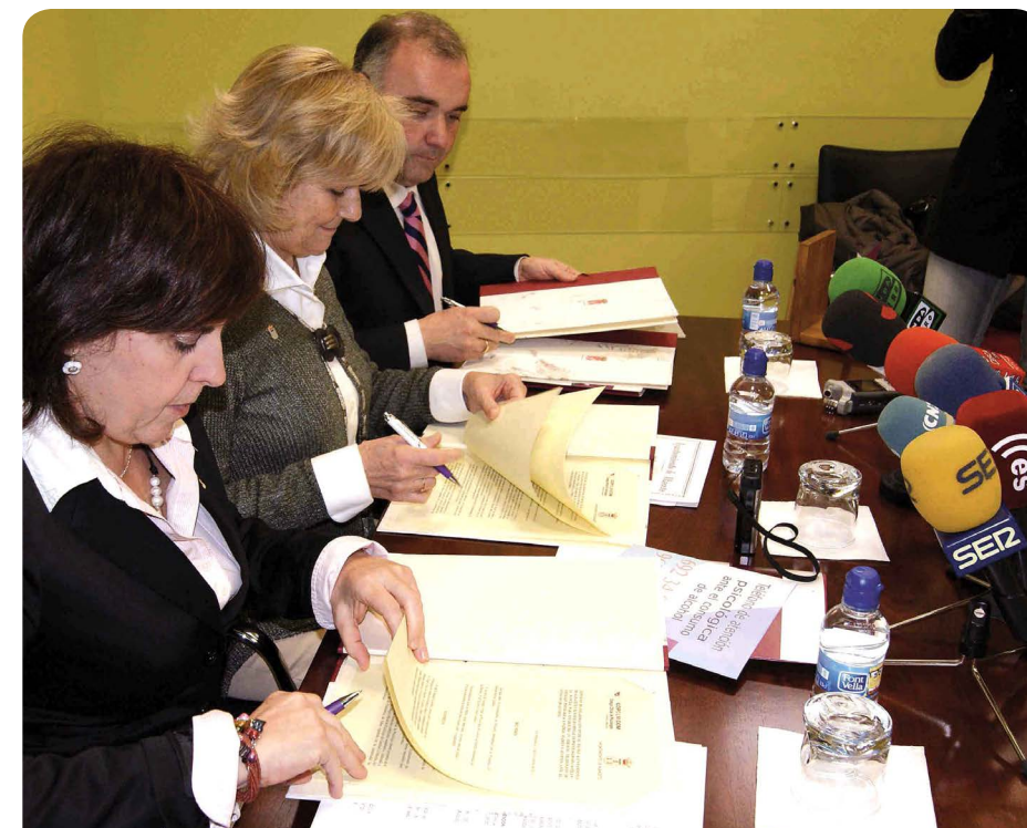
El Ayuntamiento y la Diputación apoyan la iniciativa de la institución colegial

Por el momento, la celebración de los talleres está siendo un rotundo éxito y se espera exportar esta iniciativa a más institutos de la capital y de la provincia de Albacete lo que constituye un éxito para la institución colegial y un motivo más para seguir combatiendo el alcoholismo entre la juventud.