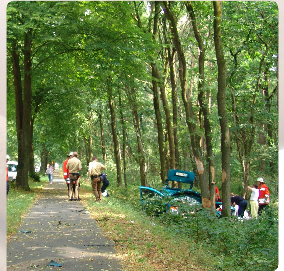
La labor de los psicólogos en situaciones de emergencia es necesaria

Desde el trágico suceso del accidente ferroviario en Chinchilla, que además supuso el inicio de las intervenciones del GIPEC-COPCLM, el grupo ha desarrollado su labor en catástrofes como el incendio de Guadajajara, muertes súbitas, accidentes de tráfico, atropellos, comunicación de malas noticias,