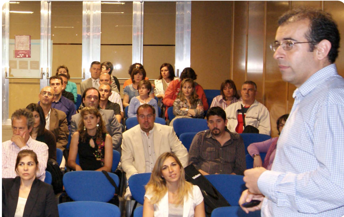
Imagen de la edición celebrada en el Museo de las Artes y las Ciencias de Castilla-La Mancha ubicado en Cuenca