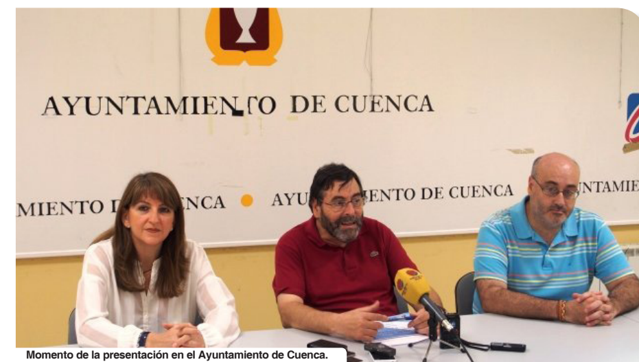
Momento de la presentación en el Ayuntamiento de Cuenca.

El objetivo fundamental del servicio es la prevención ante el consumo de alcohol y, por otro lado, también se pretende que aquellos adolescentes que hayan podido iniciarse en el hábito de beber alcohol, así como las madres y los padres a los que les preocupe este hecho, dispongan de un recurso donde poder plantear todas sus dudas.