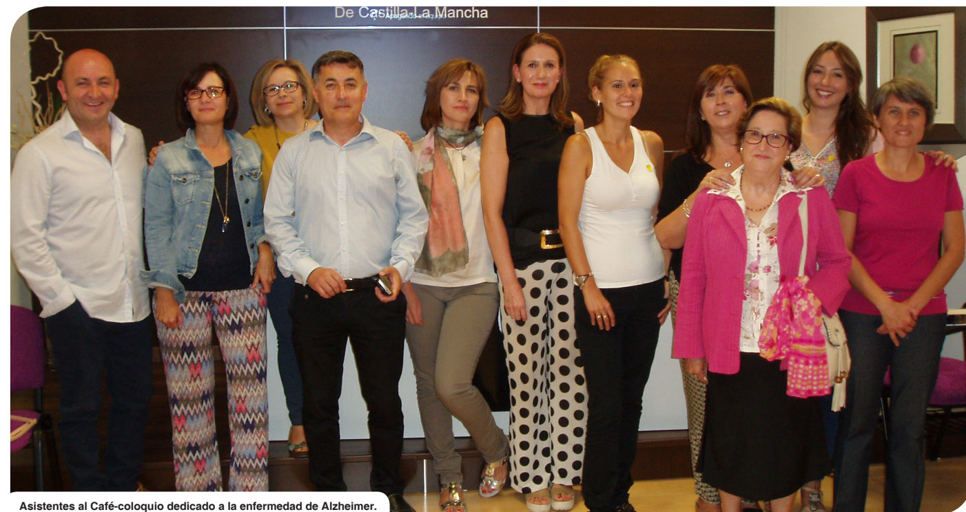
Asistentes al Café-colquio dedicado a la enfermedad de Alzheimer.

El Alzheimer y todas las demencias deberían ser tratadas como una enfermedad familiar.