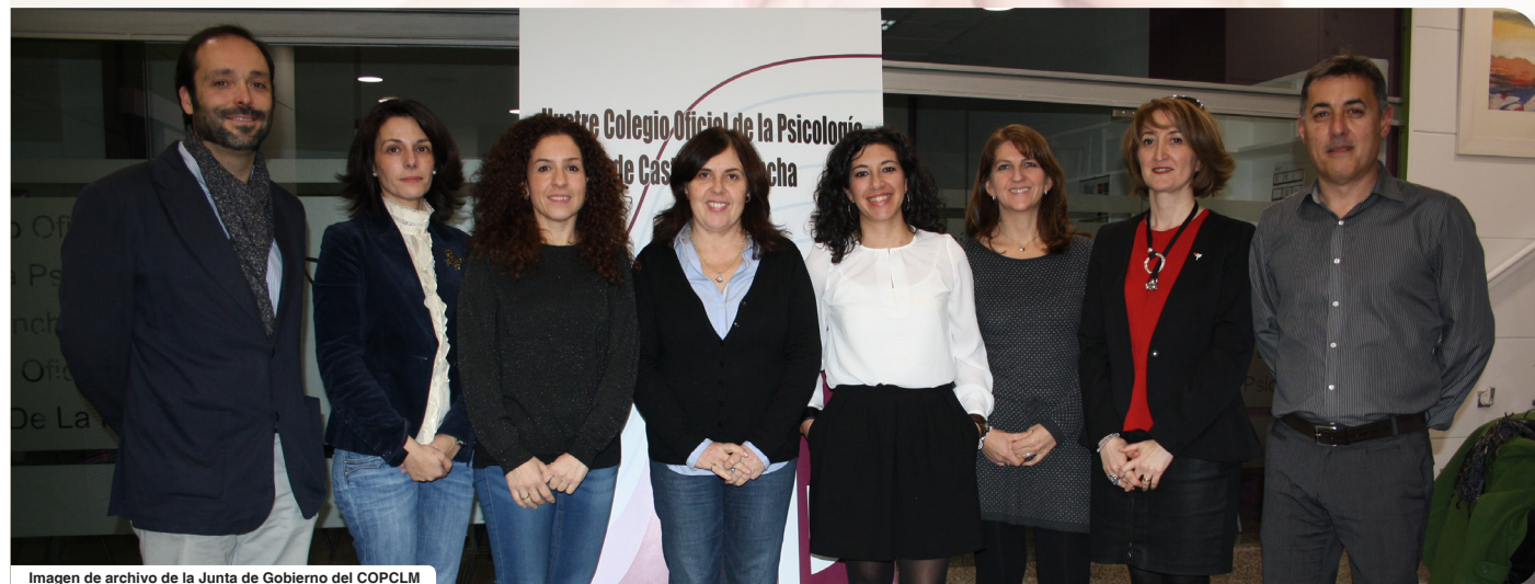
Imagen de archivo de la Junta de Gobierno del COPCLM

divisiones y programas. Por último, es de destacar que también se aprobó la convocatoria de Elecciones Ordinarias para el nombramiento de nueva Junta de Gobierno del Colegio, de conformidad con las disposiciones del Título IV, Capítulo II de sus Estatutos, así como el calendario electoral