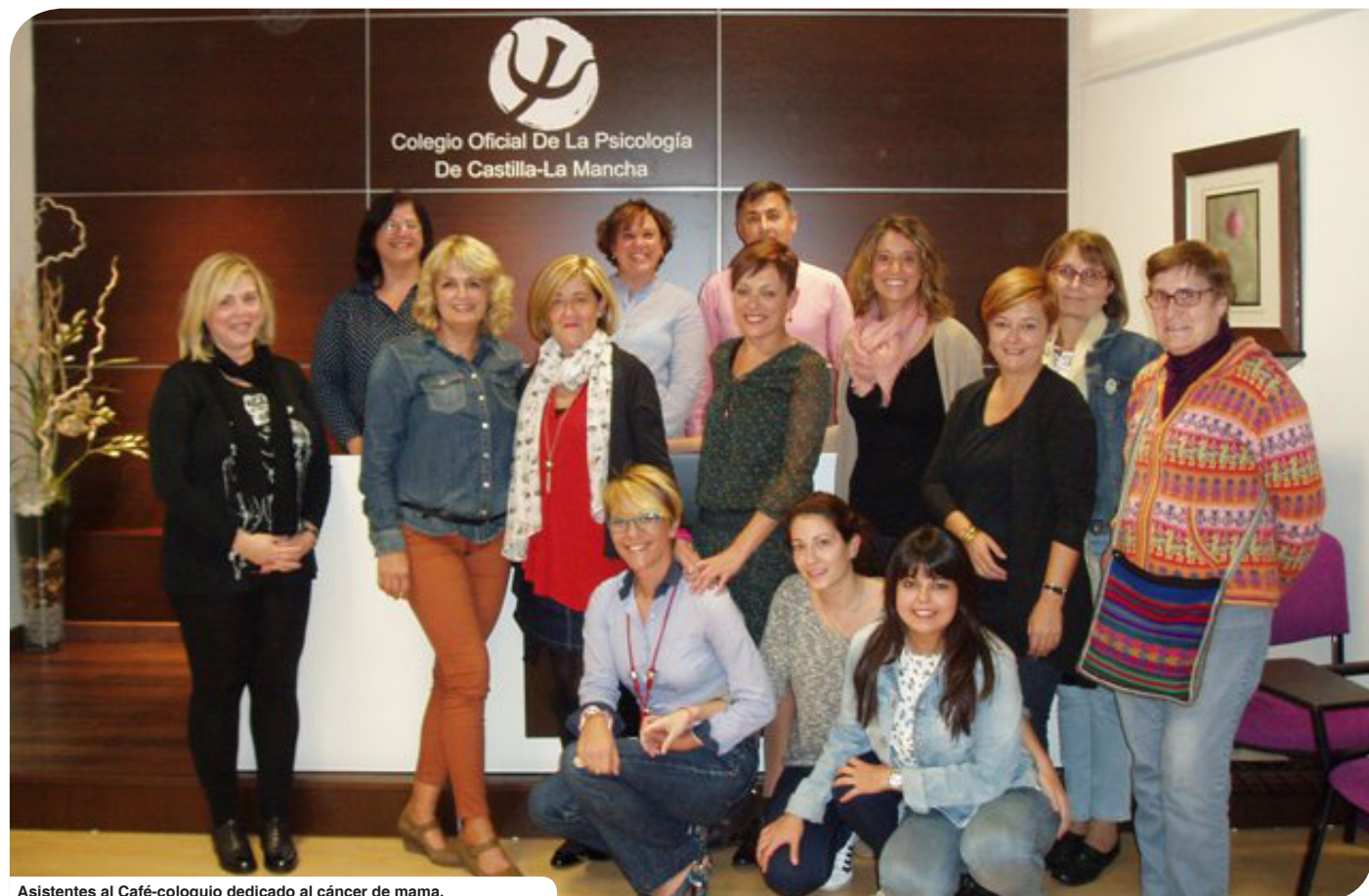
Asistentes al Café-coloquio dedicado al cáncer de mama.

Todas las personas que participaron en esta actividad coincidieron en la necesidad de una contribución mayor y activa de la Psicología en este colectivo, proponiendo, entre otras cosas, la colaboración en futuras actividades del COPCLM en temas relacionados con el cáncer de mama.