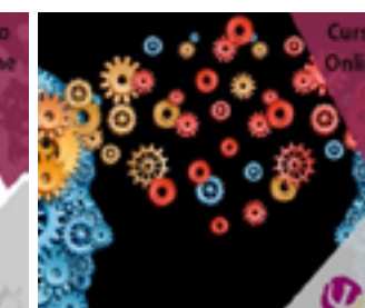
Perspectivas actuales TOC