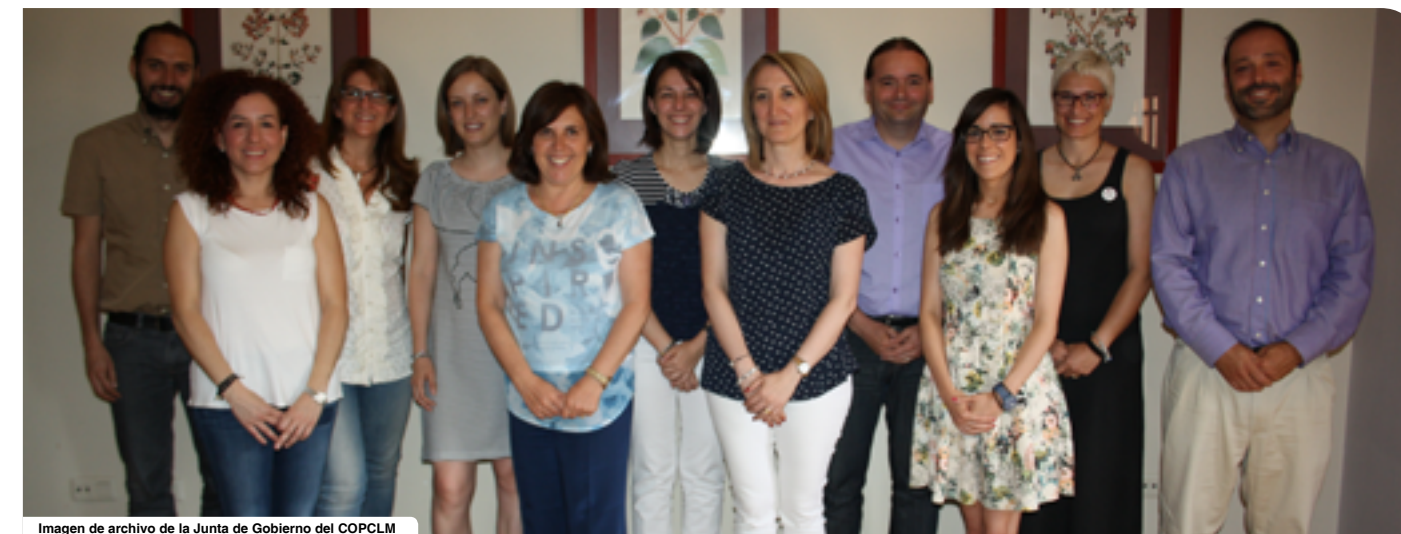
Imagen de archivo de la Junta de Gobierno del COPCLM

Durante el año 2017, la Junta de Gobierno del COPCLM tiene como objetivo prioritario dinamizar la actividad colegial en toda la Comunidad Autónoma.