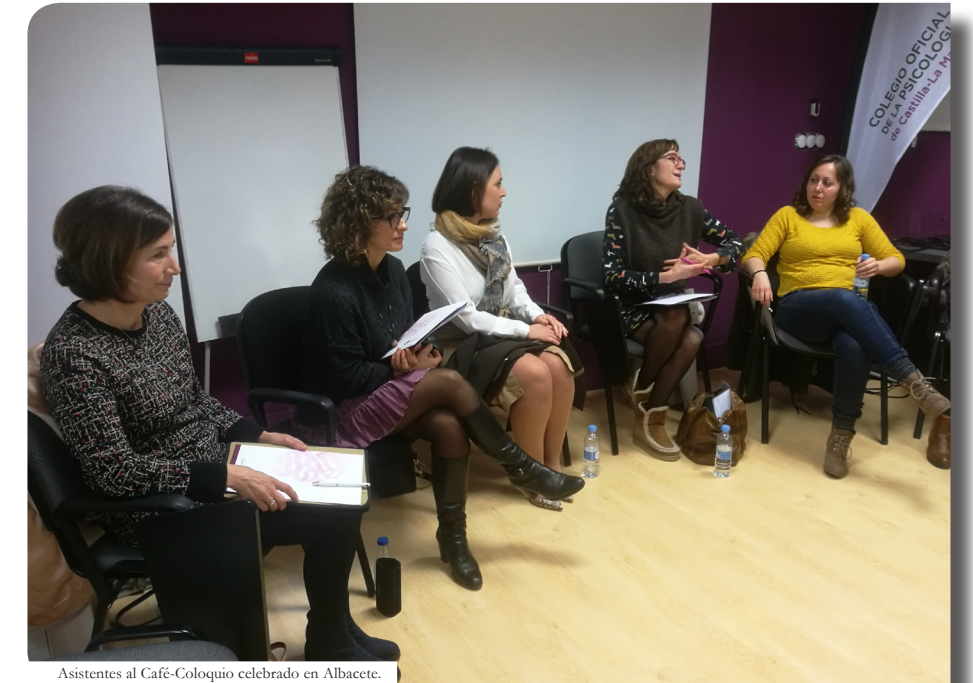
Asistentes al Café-Colquio celebrado en Albacete.

También se habló de la importancia de la humanización del parto, y como los detalles y la cercanía con el profesional sa-