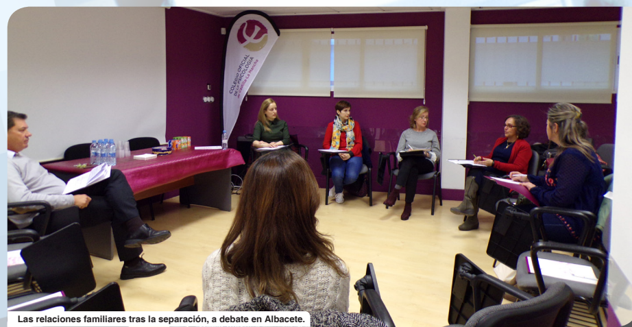
Las relaciones familiares tras la separación, a debate en Albacete.