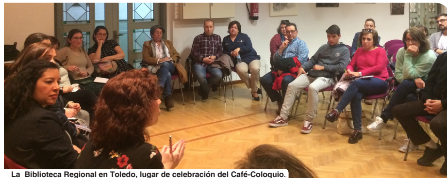
La Biblioteca Regional en Toledo, lugar de celebración del Café-Coloquio.

En el caso de Toledo, el salón de actos de la Biblioteca Regional fue testigo, el martes 26, del éxito de participación en el Café-Coloquio “Mamá, ¿soy raro?”, organizado por el Colegio Oficial de la Psicología de Castilla-La Mancha en la capital regional.