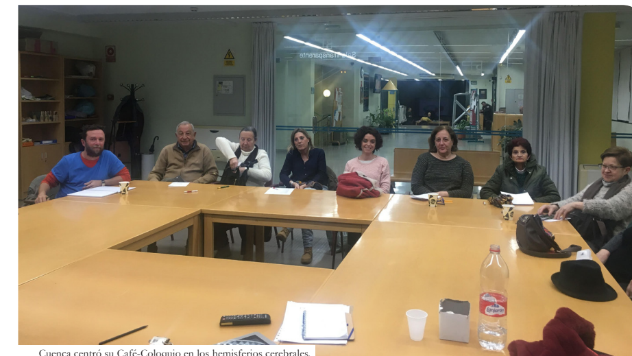
Cuenca centró su Café-Colquio en los hemisferios cerebrales.

Los asistentes expresaron sus ideas y experiencias personales sobre sus predominancias y se formó un nutrido debate acerca de las necesidades de integrar ambos hemisferios en la educación infantil tanto en casa como en la escuela y la consideración de ambos hemisferios en nuestras relaciones en el día a día.