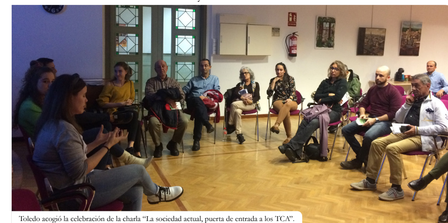
Toledo acogió la celebración de la charla “La sociedad actual, puerta de entrada a los TCA”.