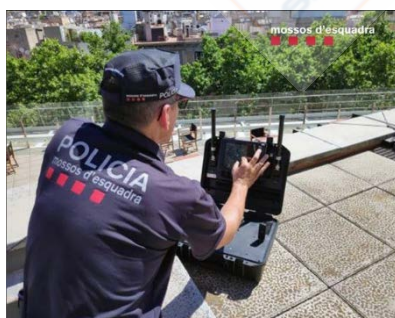
Imagen. – Intervención con drones por Mossos d'Esquadra.