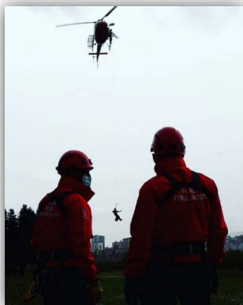
Imagen. – Entrenamiento en rescates de Policía Foral de Navarra.