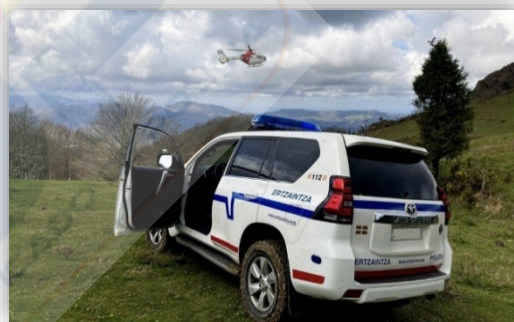
Imagen. – Unidad de Vigilancia y Rescate de Ertzaintza.